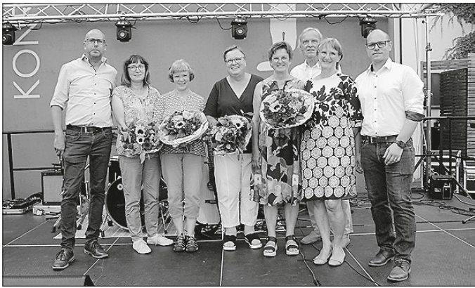
Nicht nur die KBS selbst feiert Jubiläum – auch langjährige Mitarbeitende wurden geehrt. Außerdem wurden Beschäftigte in den Ruhestand verabschiedet.