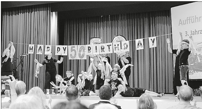
Mit buntem Bühnenprogramm feiert die KBS ihren 50. Geburtstag.